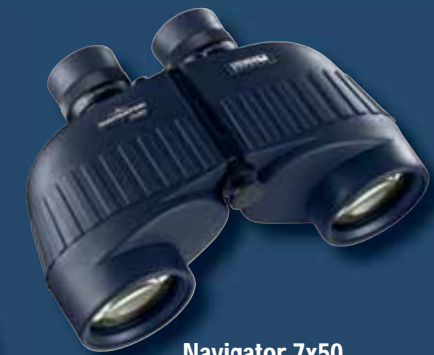
Navigator 7x50 ohne Kompass

Alle weiteren technischen Features sind identisch mit der Kompass-Version.