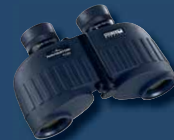
Navigator 7x30 ohne Kompass

Alle weiteren technischen Features sind identisch mit der Kompass-Version.