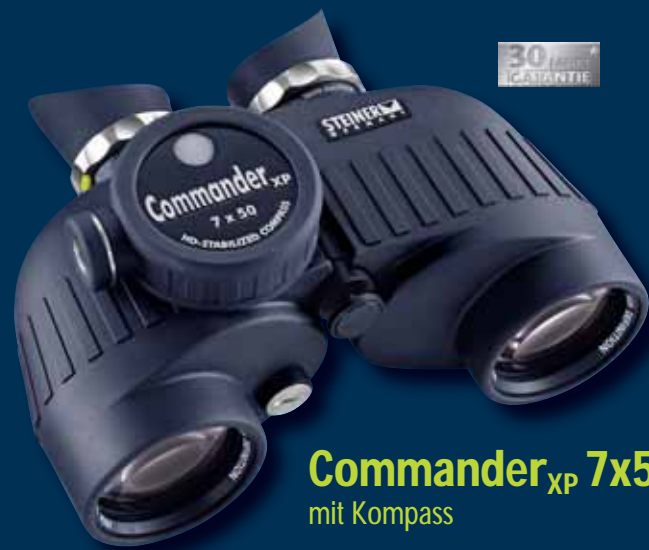
Commander XP 7x50 mit Kompass