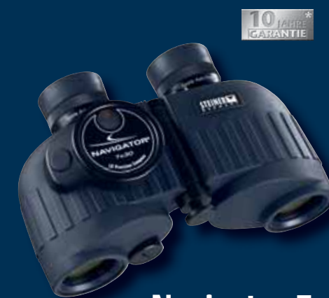
Navigator 7x30 mit Kompass