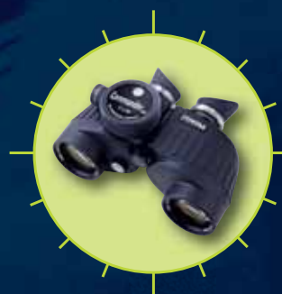
Commander XP 7x50

Die neue Generation! Professionelle Marine-Ferngläser vom Weltmarktführer.