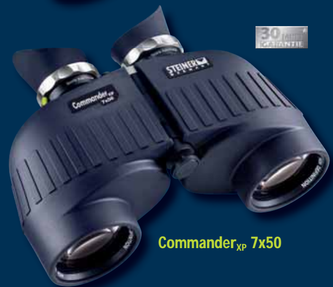
Commander XP 7x50