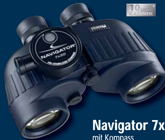
Navigator 7x50 mit Kompass